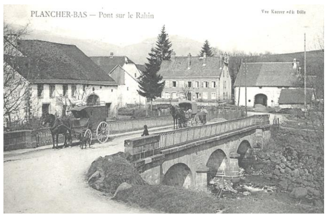
34808 - Quartier de l'Eglise - PLANCHER-BAS (Haute-Saône)